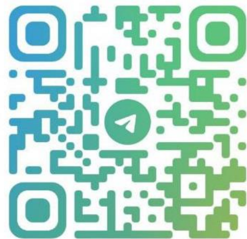
Telegram “Школа родителей “Семья”