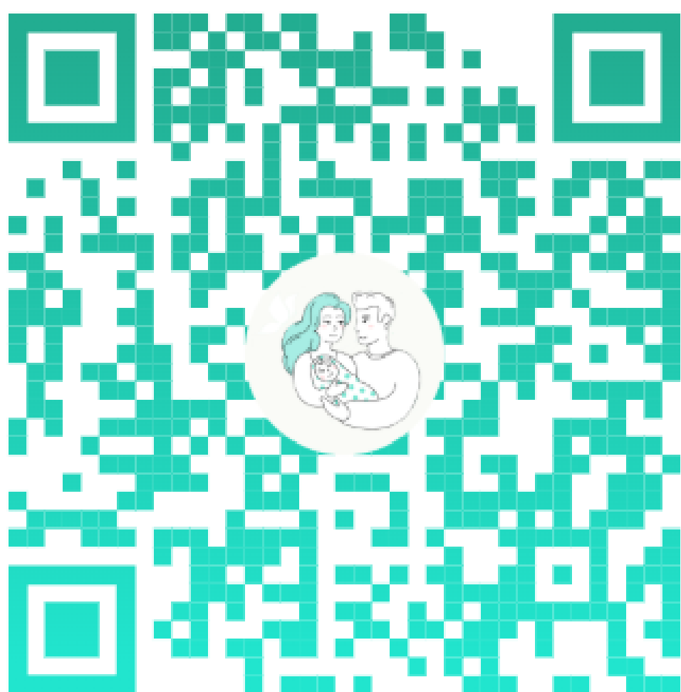
Сайт ресурсного центра “Ранней помощи”